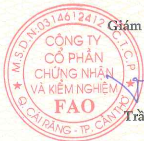
Trần Như Ý