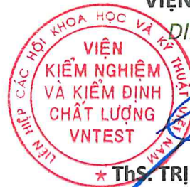
★ Ths. TRỊNH CÔNG SƠN